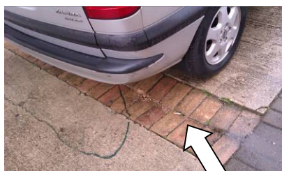
joints en briques