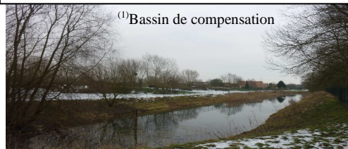
(1) Bassin de compensation

Aujourd'hui le renouvellement des idées et des personnes enrichira et permettra un second souffle pour entamer les « 22 » prochaines années.